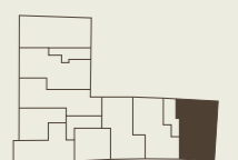
Lage im Gebäude Position in the building