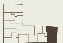
Lage im Gebäude Position in the building