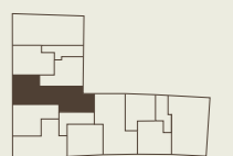
Lage im Gebäude Position in the building