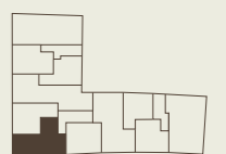
Lage im Gebäude Position in the building